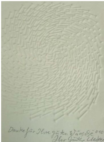
Günther Uecker, o. T., 2010, Prägedruck

Während unseres Rundgangs durch die Ausstellung sammeln wir gemeinsam Begriffe, die wir mit „Schwarz“, „Weiß“, „Schwarzweiß“ sowie mit „Dreieck“, „Viereck“ und „Kreis“ in Zusammenhang bringen. Außerdem lernen wir den Künstler Günther Uecker kennen, der mit Nägeln und Licht und Schatten arbeitet. Im anschließenden Workshop gestalten wir, durch unsere Sammlung inspiriert, Malpappe mit geometrischen Formen in schwarzer und weißer Farbe mit Nägeln. Die fertigen Kunstwerke werden vor einer Lichtquelle inszeniert und gemeinsam besprochen.