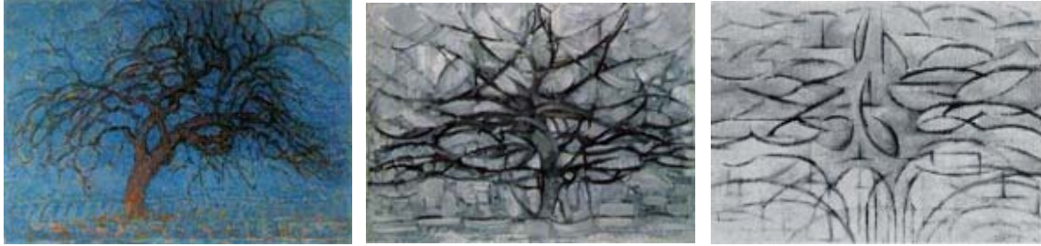
Piet Mondrian: Abend 1908, Grauer Baum 1911, Blühender Apfelbaum 1912

Mithilfe der Ausstellung „Poesie und Prosa“ erfahren wir, wie Künstler vom Gegenstand zur Abstraktion gekommen sind und was der Begriff „abstrakt“ überhaupt bedeutet. Wir notieren uns Gedanken zu einzelnen Bildern, formen daraus Gedankenketten und bekommen so einen besseren Einblick in das Bildgeschehen. Umgeben von abstrahierten Kunstwerken versuchen wir uns ebenfalls an einer Abstraktion à la Piet Mondrian (siehe Abbildungen).