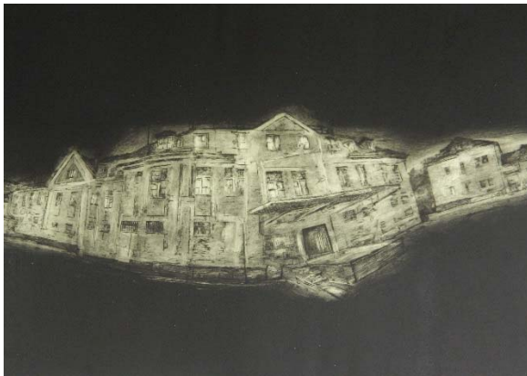
Hans Lindner, Nummer 62, 1987

Das MMK präsentiert aus seiner Sammlung Gemälde, Grafiken, Fotografien und Objektbilder zeitgenössischer Künstler, vornehmlich aus Deutschland und Österreich. Es werden sowohl gegenständliche als auch abstrakte, sowohl lebhaft farbige als auch monochrom-lineare Gestaltungen gezeigt. Gemeinsam ist den meisten Werken die ihnen inwohnende „Poesie“, eine nahezu magische Wirkung, die vor allem im Bereich der Stille, jenseits von Pathos und Aufdringlichkeit, angesiedelt ist.