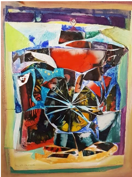
Otto Sammer, Das alte Karussell, 1974

„OTTO SAMMER – AUS DEM ATELIER“ (2. DEZEMBER 2017 BIS 4. MÄRZ 2018)