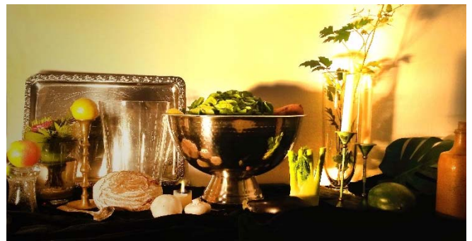
Stillebenbeispiel unbearbeitet und bearbeitet

Nach einem Rundgang durch die Ausstellung lassen wir uns von den großformatigen Stillleben-Arrangements der Künstlerin Vera Mercer inspirieren. Dabei arrangieren wir mit Obst und Gemüse sowie anderen Gegenständen, die wir auf Mercers Bildern entdeckt haben, unsere eigenen Stillleben. Nachdem wir verschiedene Beleuchtungsszenen getestet haben, werden die Stillleben mit dem Fotoapparat oder dem eigenen Smartphone fotografiert und anschließend mit Photoshop oder mit einer App digital nachbearbeitet.