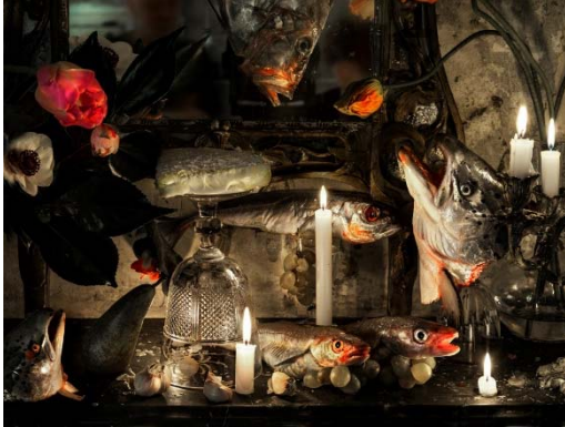
Vera Mercer, Fishes, 2014

Mit der Fotografin Vera Mercer (*1936 in Berlin) präsentiert das MMK nach Friedrich Meckseper eine weitere Auseinandersetzung mit der Gattung Stillleben. Die Künstlerin nimmt mit ihren üppigen Arrangements aus pflanzlichen und tierischen Elementen mit klassischen Accessoires wie Gläsern, Kerzen und Schalen Bezug auf die barocke Stilllebenmalerei der Niederlande des 16. und 17. Jahrhunderts.